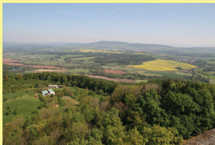
Český ráj, nejstarší česká CHKO a kolébka české turistiky. Dlouhodobě obhospodařovaná kulturní krajina. Povede právě tudy rychlostní silnice R47? Další příklad možné diskontinuity.

Jaká je role společenských věd při zkoumání současných globálních i lokálních environmentálních problémů? Biologické vědy jsou schopny tyto problémy popsat. Technické vědy často dokáží navrhnout možná řešení. Jak to, že i když tato řešení známe a víme co nám hrozí, stejně ke změnám k lepšímu mnohdy nedochází? Odpověď mohou poskytnout společenské vědy. Společnost, její kultura jako způsob adaptace na změny prostředí, je hlavním zdrojem problémů, ale zároveň i hlavní silou ke změně postojů a hodnot k přírodě, krajině a člověku.