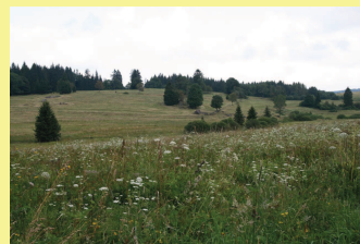
Druhá strana mince. Pohůří na Šumavě v Novohradských horách v roce 2009. Před 2. světovou válkou zde žilo téměř 2000 obyvatel – příklad opouštění krajín.