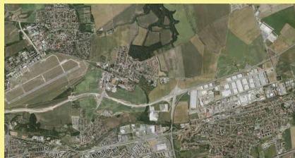
Rozvoj společnosti je velmi dynamický a rychlý a zanechává své stopy v krajině. Krajina severovýchodního okraje Prahy (Homí Počernice, Kbely, Černý Most) v letech 1953 a 2008 – příklad intenzifikace.