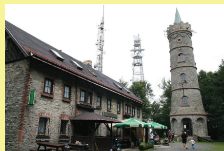
Budeme-li se ovšem pozorně dívat kolem sebe, zjistíme, že některé nové role krajiny jsou vlastně celkem staré. Rozhledna Jedlová v Lužických horách, postavena roku 1891.