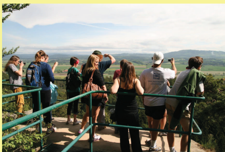
Mimoprodukční funkce krajiny jsou stále důležitější. Můžeme hovořit o krajině jako PETosféře. Příroda, Estetika, Turismus (nebo také anglicky domácí mazlíček – pet). V krajině se méně žije a méně hospodaří, ale často do ní jezdí. Někdy se tyto funkce střetávají i mezi sebou (estetika, turismus vs. ochrana přírody). Na snímcích čeští a zahraniční studenti obdivují Český ráj a provozují land-art.