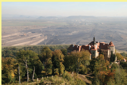
Hnědohušný povrchový lom ČSA a zámek Jezeří. Vysoké emise CO 2 , zničení biodiverzity, bourání vesnic a ohrožení kulturních památek – devastace kulturní krajiny v přímém přenosu posledních 30ti let – příklad diskontinuity vývoje.