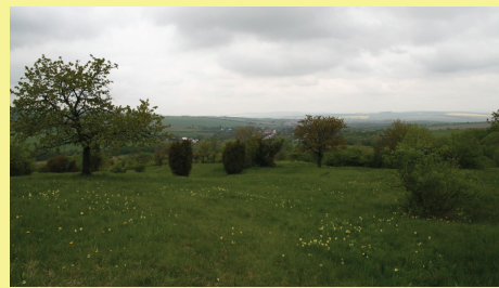
Někdy je těžké říci, kde končí příroda a kde začíná kultura. Bývalá pastvina, dnešní Národní přírodní rezervace Drahy v Bílých Karpatech. Nebudeme-li tuto krajinu udržovat, vyroste zde les. Kulturní krajina jsou i naše představy, znaky a symboly externalizované do krajiny.

Kulturní krajina vzniká dlouhodobým působením sil přírody a společnosti, krajina je medium, kultura je činný agens, výsledkem je kulturní krajina ve smyslu zakladatelské definice C. O. Sauera. V České republice je jen velmi málo krajín zcela přírodních.