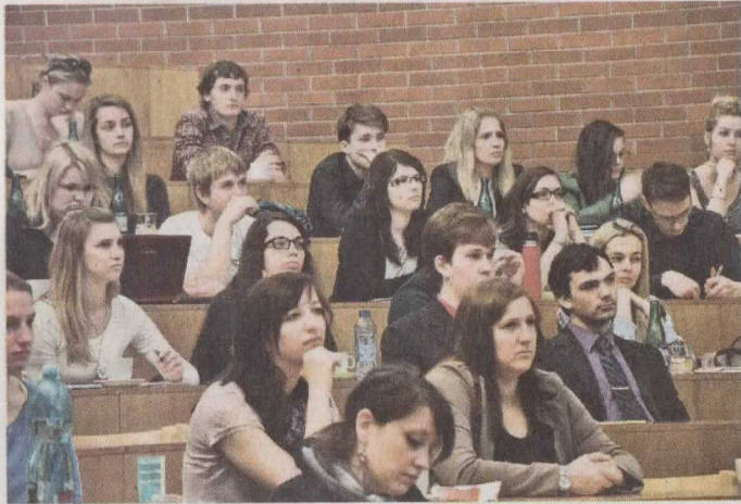
SETKÁNÍ odborníků z různých oborů se uskutečnilo v dubnu na Jihočeské univerzitě.